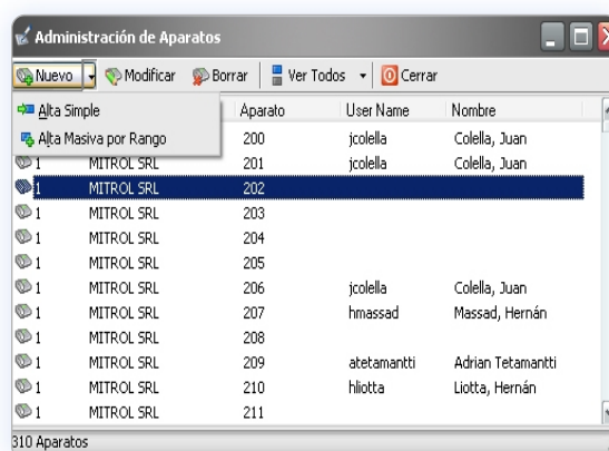
Pantalla de administración de usuarios.