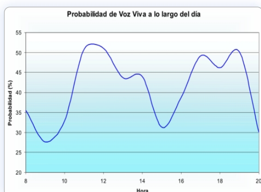
Pantalla de Probabilidad de Voz Viva.